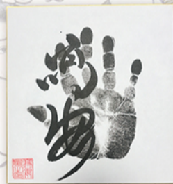
●力士直筆サイン例

お楽しみコーナー&抽選会も実施 開場直後からの力士四名による握手会のあと、力士に直接質問して大相撲の知識を深めていただける質問コーナーや、ご来場の皆様から抽選で20名様に、力士直筆サインや相撲土産が当たる、お楽しみ抽選会も行います。巡業ならではの楽しい企画が盛りだくさんです。